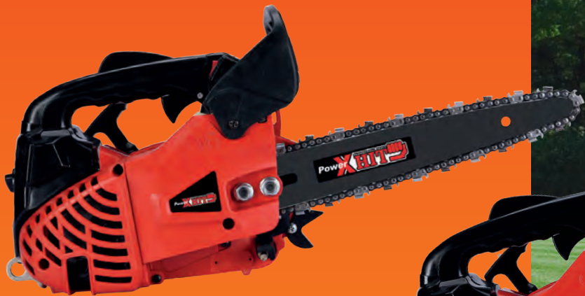
PHM255C MOTOSEGA A SCOPPIO PER POTATURA BARRA CARVING