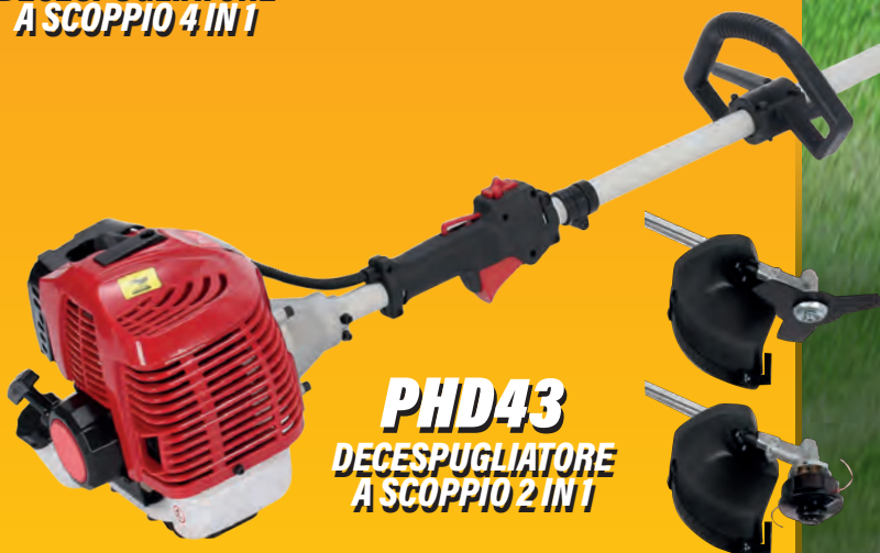
PHD43 DECESPUGLIATORE A SCOPPIO 2 IN 1