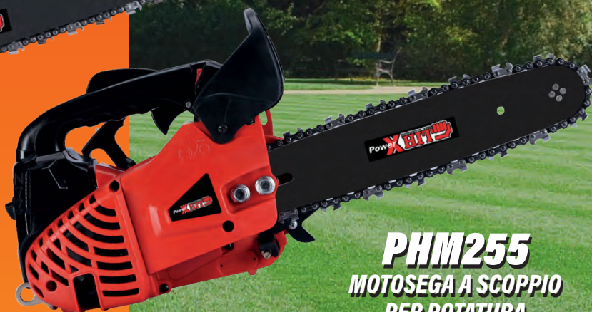
PHM255 MOTOSEGA A SCOPPIO PER POTATURA