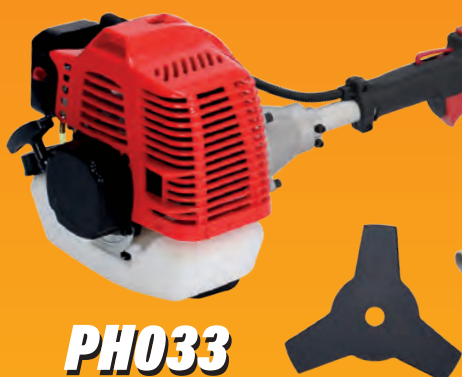
PH033 DECESPUGLIATORE A SCOPPIO 4 IN 1