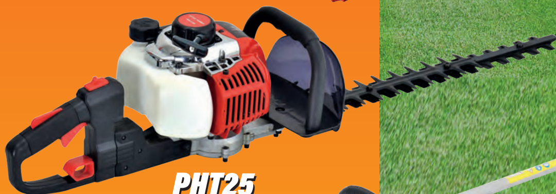
PHT25 TAGLIASIEPI A SCOPPIO